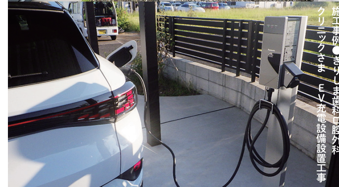
施工事例 ● さりし クリニックさま EV充電設備設置工事