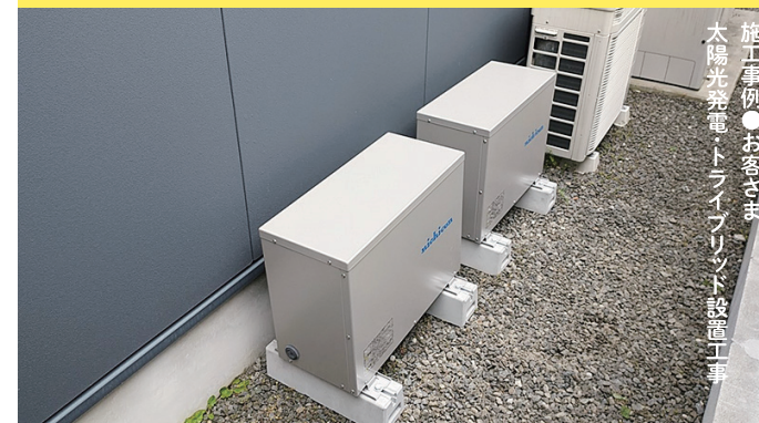
施工事例 ● お客さま 太陽光発電・ドライフリント設置工事

INFORMATION / エコキュート、冬のトラブル注意報 PICK UP / ネクストパワーやまとのスタッフを紹介