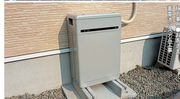
施工事例 ●お客さま 蓄電池システム工事