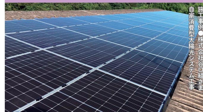
施工事例 ●株式会社谷口組さま 自家消費型太陽光システム工事